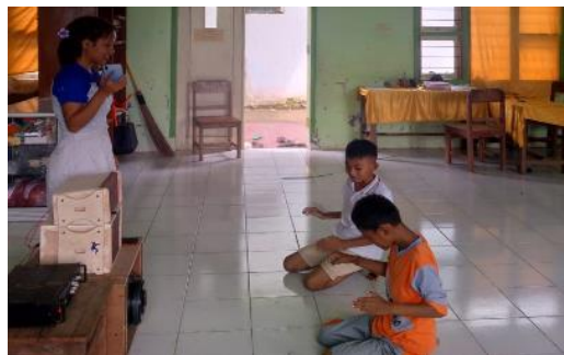
Gambar 2. Siswa Berlatih Pantomim

Kegiatan yang dilakukan pada gambar tersebut yaitu Kegiatan pelatihan tari yang bertujuan untuk mengembangkan kreativitas dan meningkatkan kepercayaan diri siswa. Melalui pelatihan ini, siswa belajar mengekspresikan diri melalui gerakan tari dan mempersiapkan diri untuk berkompetisi di Festival dan Lomba Seni Siswa Nasional (FLS2N). Selain itu, kegiatan ini juga bertujuan melestarikan budaya lokal melalui pengenalan tari tradisional Nusantara.