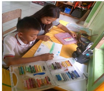
Gambar 3. Siswa Belajar Menggambar

Kegiatan yang selanjutnya yaitu Pantomi, kegiatan ini bertujuan untuk untuk mengembangkan ekspresi emosional dan kemampuan komunikasi nonverbal siswa. Melalui pantomim, siswa belajar menyampaikan perasaan dan cerita tanpa menggunakan kata-kata, sehingga meningkatkan kreativitas dan imajinasi mereka. Selain itu, kegiatan ini juga membantu meningkatkan kepercayaan diri saat tampil di depan umum dan melatih keterampilan ekspresi wajah serta gerakan tubuh secara artistik. untuk mengembangkan ekspresi emosional dan kemampuan komunikasi nonverbal siswa. Melalui pantomim, siswa belajar menyampaikan perasaan dan cerita tanpa menggunakan kata-kata, sehingga meningkatkan kreativitas dan imajinasi mereka. Selain itu, kegiatan ini juga membantu meningkatkan kepercayaan diri saat tampil di depan umum dan melatih keterampilan ekspresi wajah serta gerakan tubuh secara artistik.