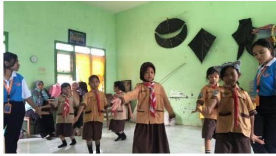
Gambar 1. Siswa Berlatih Menari

Kegiatan yang dilakukan pada gambar tersebut yaitu Kegiatan pelatihan tari yang bertujuan untuk mengembangkan kreativitas dan meningkatkan kepercayaan diri siswa. Melalui pelatihan ini, siswa belajar mengekspresikan diri melalui gerakan tari dan mempersiapkan diri untuk berkompetisi di Festival dan Lomba Seni Siswa Nasional (FLS2N). Selain itu, kegiatan ini juga bertujuan melestarikan budaya lokal melalui pengenalan tari tradisional Nusantara.